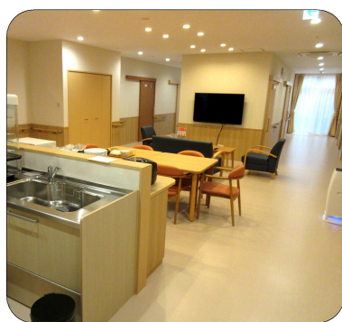
大型テレビ完備の共有スペース

現在、共同生活援助は定員一杯になっております。短期入所は二名定員(男女各一名)になっていきます。ご利用の方は、サンライズ大竹までご連絡ください。☎〇八二七五七七八六七