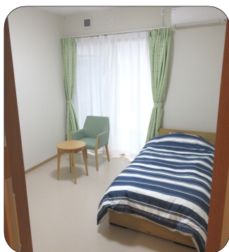
寝具等設置した居室