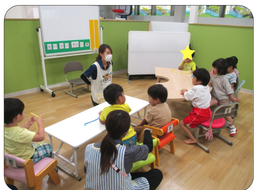
小集団での活動の様子