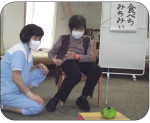
食へのみちみい からしないよ うにしまし た。競技の 方法を工夫 したことで、

今年のデイサービスミニ運動会はコロナ禍の為、密をさけ距離を保ち開催しました。恒例の競技も方法を変えて、競技道具もその都度消毒を行いました。昨年より行い好評だった「食べてみちみい」という種目は、今年は魚釣りのように行い、何色のお菓子が